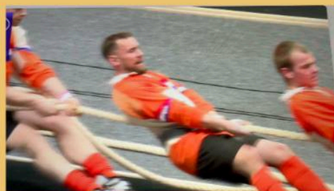
Touwtrekken is als geloven: Vasthouden en volhouden.

Op de voorkant een foto van de kerk in Wons.